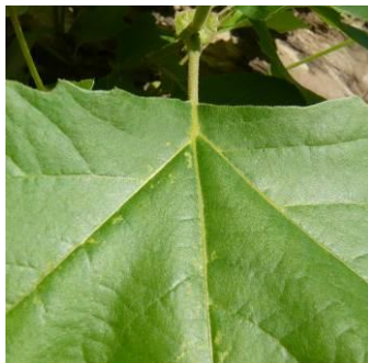
Figures de dépigmentation sur feuille de platane

Seuil de nuisibilité : 40 % de la surface foliaire dépigmentée.