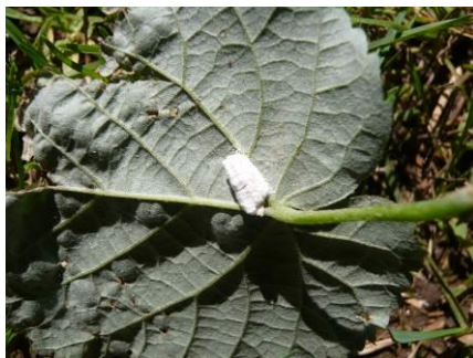
Cochenille pulvinaire sur Tilleul

Eléments de biologie : Les femelles pondent sur les faces inférieures des feuilles et recouvrent les œufs d'une sécrétion blanche (ovissac). La ponte a lieu de fin avril à début mai et peut comporter jusqu'à 2 000 œufs. Ensuite, la femelle meurt. Les larves quittent ensuite leurs ovissacs et se déplacent pour former d'importantes colonies sur le feuillage où elles se nourrissent, puis elles muent et atteignent le stade adulte. Il peut y avoir jusqu'à deux générations par an. A ne pas confondre avec Pulvinaria regalis . Ces deux espèces sont très semblables mais P.regalis ne pond que sur les troncs et les charpentières et non sur les feuilles.