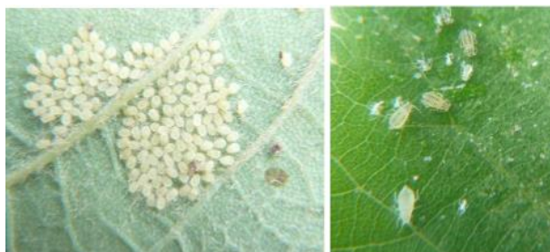
Pucerons du tilleul au stade larvaire et adulte

Des colonies d'ailés se développent ensuite sur les nouvelles pousses et sur les feuilles en croissance. Les infestations ont lieu tout au long du printemps et au début de l'été. La reproduction se ralentit au milieu de l'été, mais reprend au début de l'automne. Les pucerons piquent les feuilles afin de se nourrir, provoquant leur jaunissement puis leur chute prématurée.