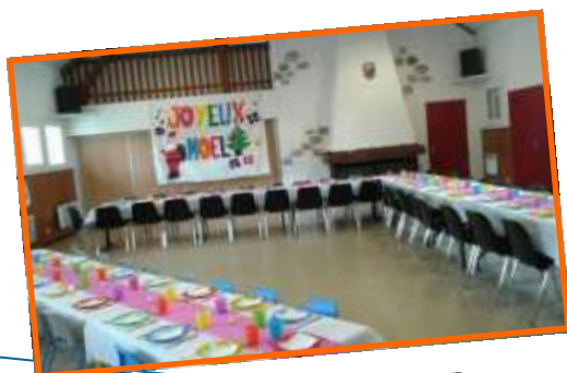
16 Décembre repas de Noël et participation au spectacle de Noël de l'APE