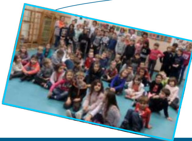
22 novembre Journée Droits de l'Enfant