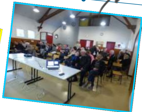
25 juin Fête de l'école et remise de dictionnaires aux CM2