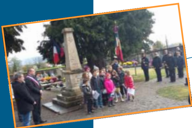
11 Novembre Commémoration Armistice