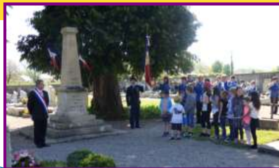
8 Mai Commémoration Armistice