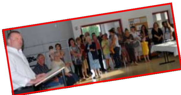
27 mai Fêtes des Mères