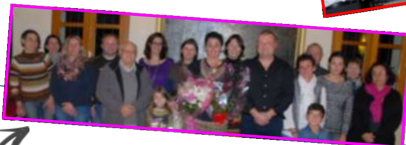
15 novembre Départ de la Directrice de l'école