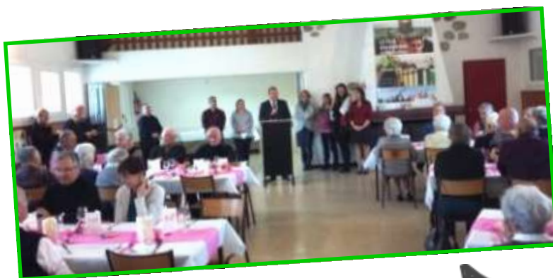
20 novembre Repas des Aînés