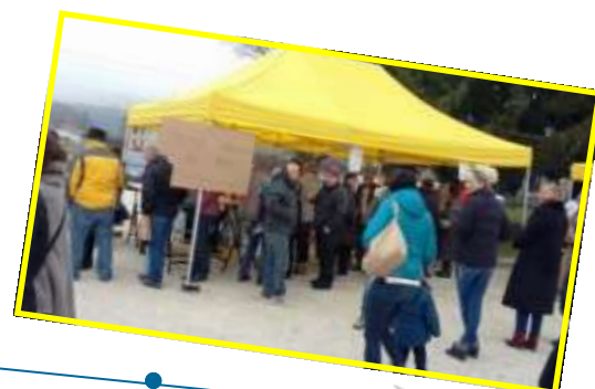
18 Décembre marché Noël de l'APE