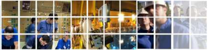
Information de la centrale de Saint-Alban Saint-Maurice (Isère).