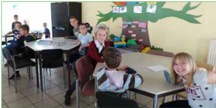
En attendant le 2ème service