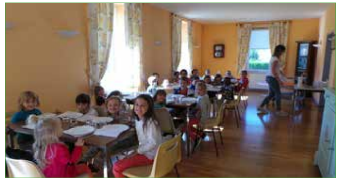
Des midis de partage dès le plus jeune âge