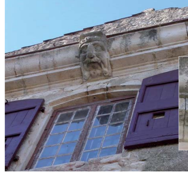
Mascarons du château de Saint-Martin-de-Pallières.

dû notamment à l'arrivée de nombreux étrangers. Sa silhouette se modifie dès 1820 avec la restauration du château, dégradé à la période révolutionnaire. Ce dernier est également agrandi entre 1862 et 1865 (tour et façades de la partie ouest, aile est du château). Quant au village, la tour de l'Horloge sera construite en 1830 et de nouvelles places apparaissent, comme la place Majouralo, construite à l'occasion de la formation des faubourgs.