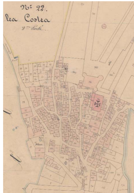
Extrait du cadastre napoléonien : le cœur du village et le château dans la première moitié du XIX e siècle.

Dominant les vallées du Grand Vallat et de la Bastidette, il est situé le long de l'ancienne voie de communication entre Draguignan et la vallée de la Durance. Son emplacement est donc stratégique. Le territoire de Saint-Martin est occupé par l'homme dès la Préhistoire. L'habitat est alors situé en hauteur. Au cours de l'Antiquité puis au Moyen Âge, d'importantes fermes sont construites dans la plaine.