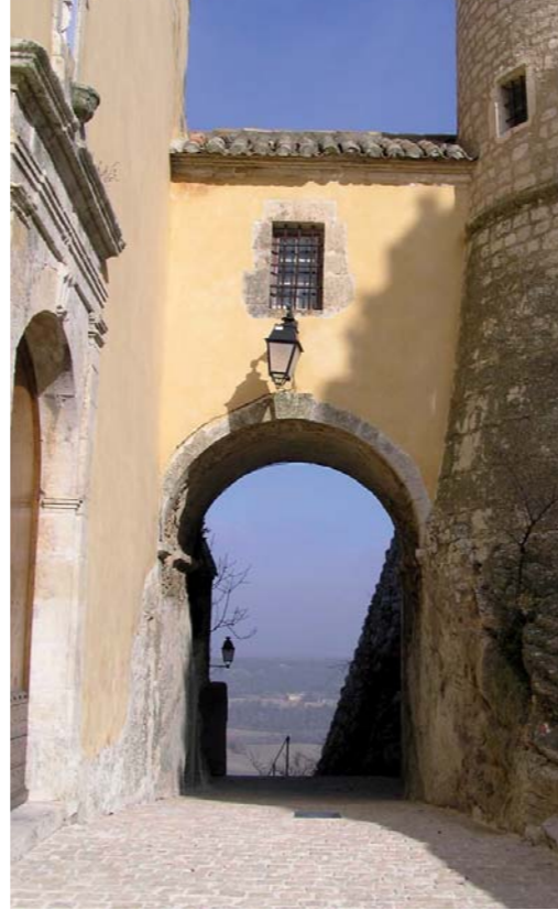
La galerie reliant la nouvelle église (XVII e siècle) au château.

Mais au XI e siècle la population se réfugie au pied du château fortifié pour se protéger des invasions répétées. Le village est alors très dynamique. À partir de 1348, il se vide de ses habitants suite à l'épidémie de peste noire. Au XVI e siècle il se repeuple et se développe grâce une forte activité agricole. Aux XVII e et XVIII e siècles, le village voit son château réaménagé pour plus de confort. Un grand parc de douze hectares y est créé avec une citerne de grande contenance ainsi que des jardins en terrasses. L'ancienne église a été abandonnée au profit de l'actuelle, construite par le châtelain François de Laurens à proximité du château. Le cimetière a été déplacé hors du village. La plupart des maisons du village datent de cette période. Quant à l'espace agricole, il est géré par les sept fermes du château pour le compte du châtelain. Aux XIX e et XX e siècles, Saint-Martin connaît tour à tour son apogée démographique en 1838 avec 472 habitants, l'exode rural à partir de 1841 puis un renouveau à la fin du XX e siècle,