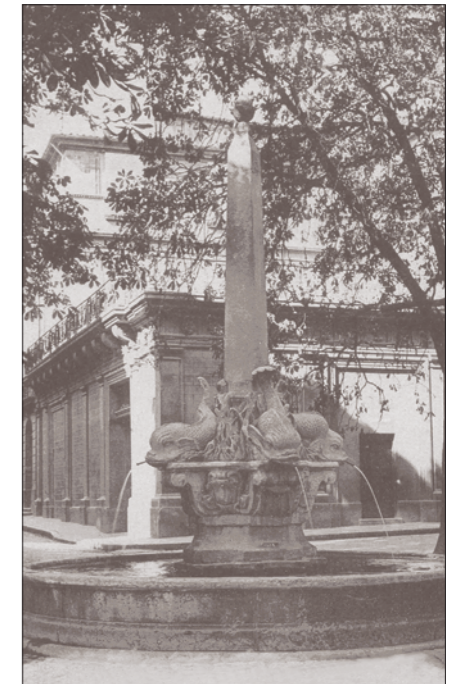
Hôtel de Boisgelin et fontaine des Quatre-Dauphins à Aix-en-Provence.

Peyrolles, semble avoir inspiré les plans de l'église dont le classicisme et la facture urbaine suscitent intérêt et surprise dans cet environnement. Un géomètre aixois, Ouvière, traça les plans du parc et conçut ses aménagements de colonnades et de balustrades. Ces multiples chantiers villageois provoquèrent dans la région un considérable appel de main-d'œuvre et de travail. Maçons, jardiniers, ouvriers de tous corps de métiers trouvèrent là, pendant plus d'un siècle, le salaire pour nourrir leur famille. À Saint-Martin, cela suscita un développement conséquent du village et explique pour beaucoup le quasi-doublement de la population dans la première partie du XVIII e siècle.