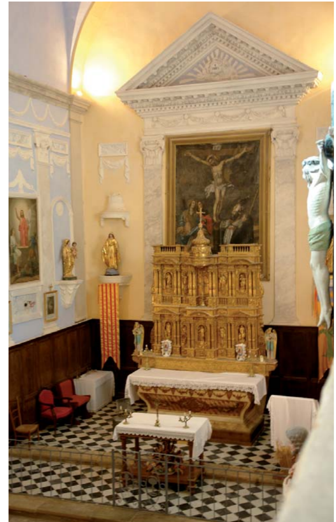
Le chœur de l'église et son retable en bois doré du XVII e siècle.