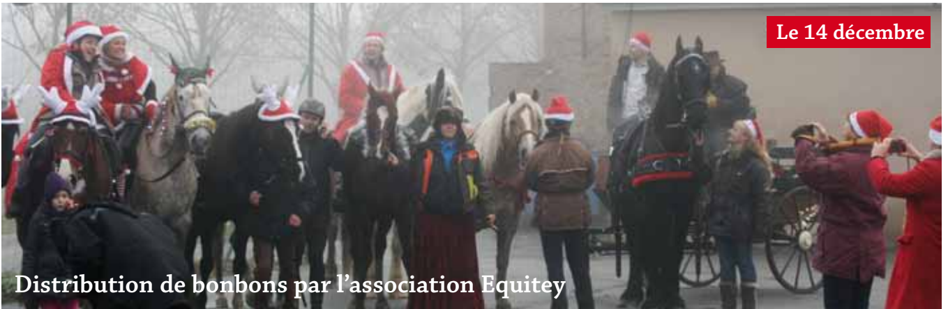
Distribution de bonbons par l'association Equitey