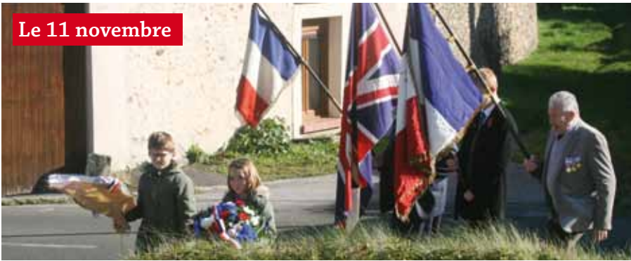
Le 11 novembre