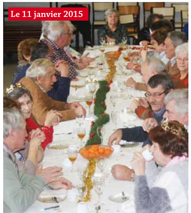
Le 11 janvier 2015