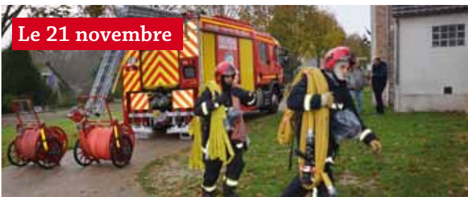
Le 21 novembre