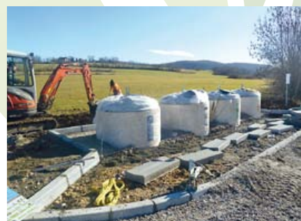
Aménagement de l'aire de tri à Choisy

Route de Seysollaz, 5 conteneurs enterrés dont 3 tri sélectif et 2 OM.