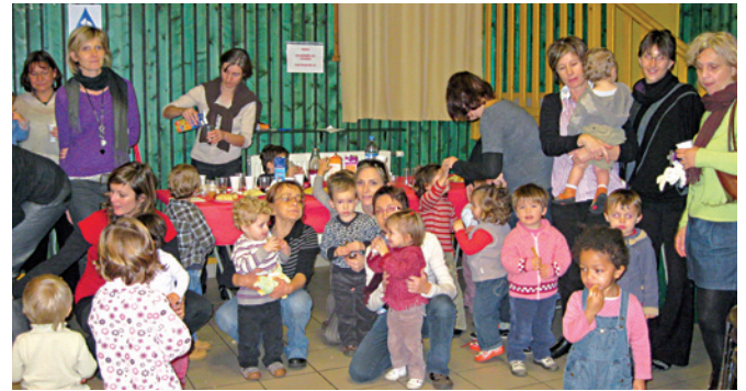
Spectacle de fin d'année commun pour les enfants du multi-accueil CCFU et de Planet Karapat

■ Le nombre de places en crèches sur la CCFU sera augmenté : il passera de 12 à 33 , par l'extension du multi-accueil «Les Petits Chamois» de La Balme de Sillingy et la création d'une première micro crèche sur Sillingy. La réhabilitation des locaux est prise en charge par les communes de La Balme et de Sillingy, soutenues par la Caisse d'Allocations Familiales.