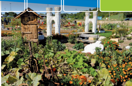
Jardins de Villy le Bouveret et Allonzier la Caille

Le projet des Jardins a également permis de développer un outil pédagogique pour les