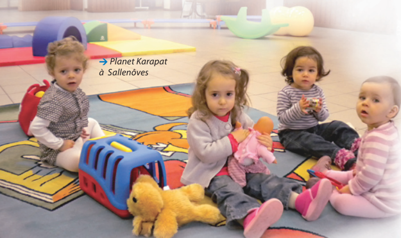
→ Planet Karapat à Sallenôves