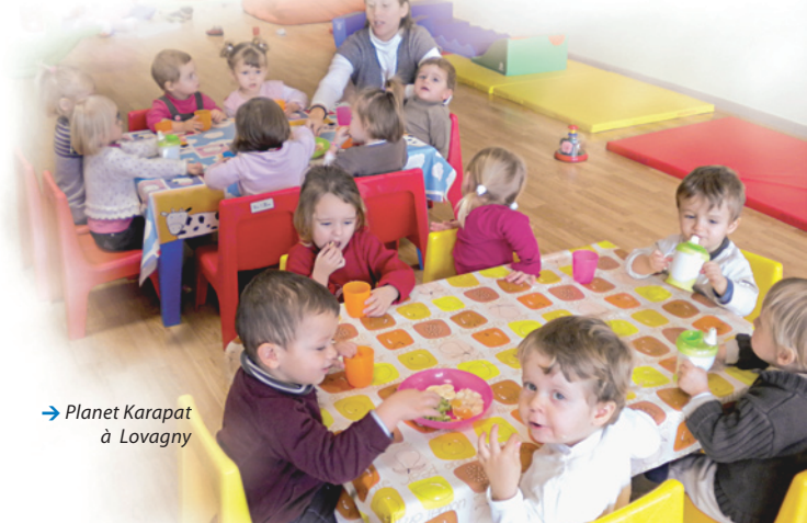
→ Planet Karapat à Lovagny