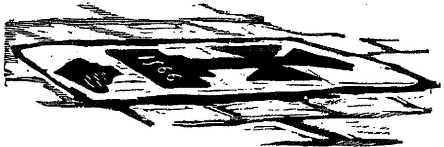
DALLE DU TOMBEAU D'UN SIRE DE LA MALLERÉE

A fut convenu et deux moués oprié, le novvian saint aviat pringu la place do vieux : ol étioit ben brave, ol aviat l'az'yeux nègres, las jodes ben rouges, la barbe rousse, la pliesse ben blan-