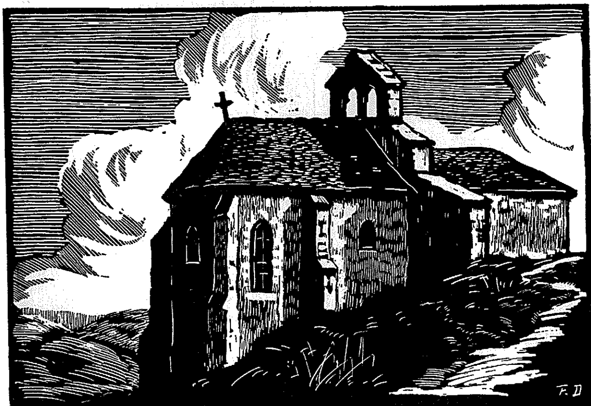
LA CHAPELLE DE SAINT-GENÈS

Et la Grelette sortit de l'église oprié d'avoir fait trois coups le signe de la croix : un co per elle, un co per sa fille et un co per l'enfant que deviot naître. La Grelette étiot s'ment pas sorquie de l'église, qu'eune voisine y creda : « Vins don vite, la Gre-