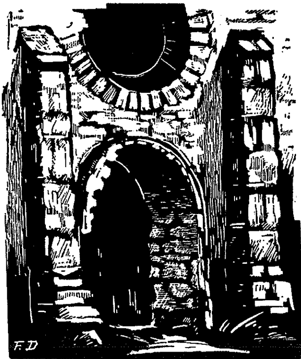
PORCHE DE LA CHAPELLE DE SAINT-GENÈS

Eve nout' défunte et première mère fasit pardre le Paradis à Adam per la faute d'un pommier, la Grelette fasit pardre à saint Genès soun église anvé sa parouesse per la faute d'un chetit pouérier.