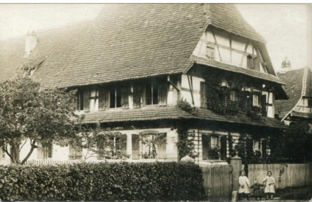
Maison typique du village avant 1914.