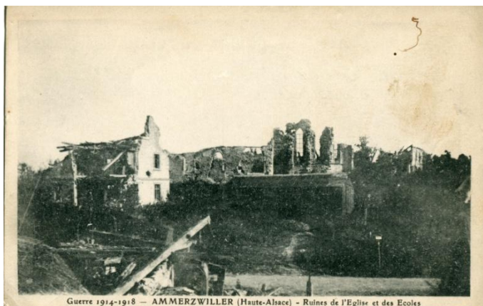
Armistice de 1918 à gauche la mairie-école à droite l'église

L'heure est désormais à la reconstruction des maisons et de l'église, elle ne sera terminée qu'en 1927.