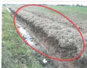
Exemple de pratique interdite

→ les cours d'eau permanents et temporaires (traits pleins et pointillés), figurant sur les cartes topographiques au 1/25000e de l'IGN accessibles sur le Géoportail, des bassins versants du Loiret, du Dhuy, des Mauves, de l'Oeuf et de la Rimarde.