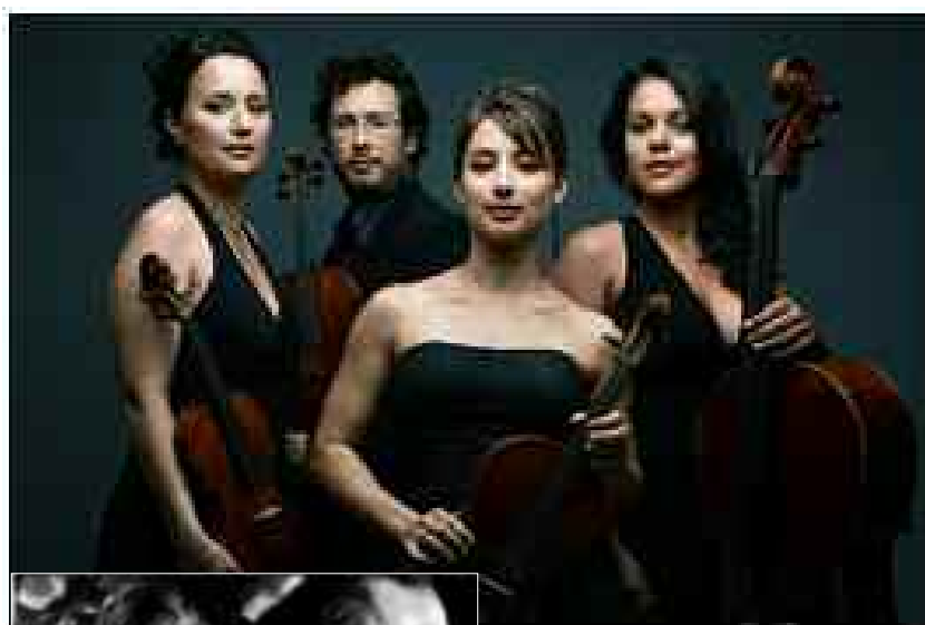
Juin 2015 : Le quatuor PSOPHOS. « Une des meilleures jeunes formations à cordes d'Europe » selon le Times.

C Malavoy : Absolument. Les deux évènements suivants sont d'ores et déjà planifiés pour 2015 (les dates seront communiquées ultérieurement).