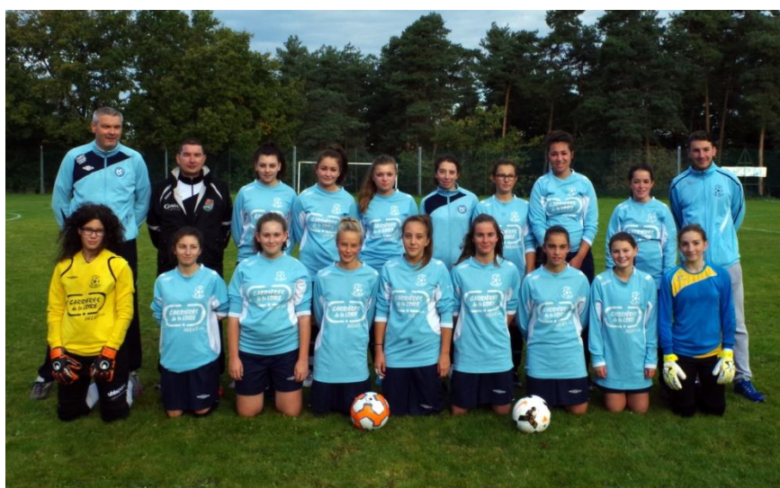
Les jeunes joueuses de la nouvelle équipe féminine

Le site de Maringes accueille les catégories :