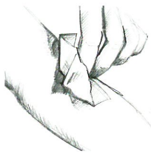
Lingette désinfectante à la chlorhexidine