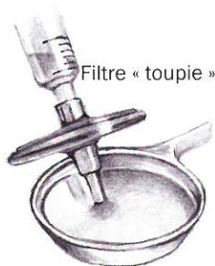
Filtre « toupie »