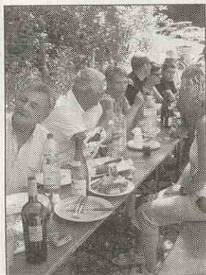
Pique-nique au pont de Balerne

Au programme, pique-nique en commun, pêche à la truite et barbecue. Le soleil étant au rendez-vous ce fut journée réussie.