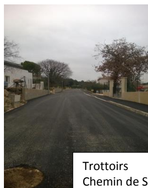
Trottoirs Chemin de St Côme