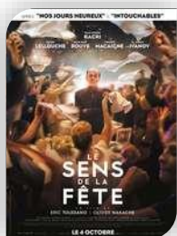
Durfort, vendredi 1er