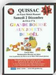
Quissac 8h à 17h, samedi 2