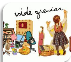
St Hippolyte du Fort, samedi 2