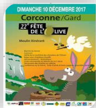
Corconne, Dimanche 10