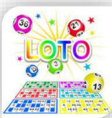
Piémont-Cévenol : Décembre 3, 10, 16, et 31