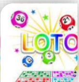
Quissac, Dimanche 3