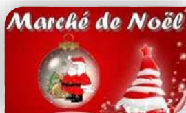
Monoblet, samedi 9