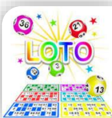
Sauve, Dimanche 17