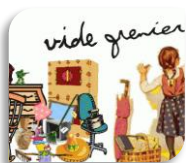
St Hippolyte du Fort, Dimanche 3