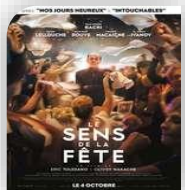
St Théodorit, samedi 2