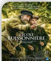
Quissac à 20h30, Mercredi 6