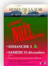
St Hippolyte du Fort, Samedi 16