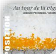
Brouzet les Quissac, 9-10