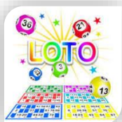
Quissac, Dimanche 17 et 31