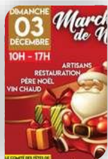
Maruéjols les Gardon, Dimanche 3