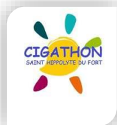
St Hippolyte du Fort, 8-9-10