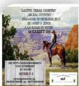
Cardet, Dimanche 3