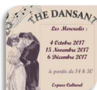
Sauve, mercredi 6

même un peu au bout du parcours. Aujourd'hui c'est un sublime mariage dans un château du 17ème siècle, un de plus, celui de Pierre et Héléna.