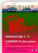
St Hippolyte du Fort, Dimanche 3