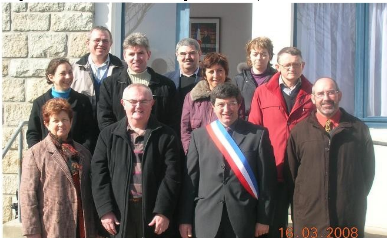
De haut en bas et de gauche à droite :