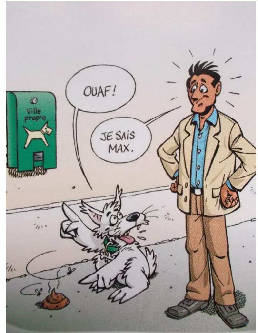
Méditons sur cette image! Merci pour tous

Esprit d'Aujourd'hui, auto-entrepreneur dans la décoration vous propose de venir nous rencontrer ainsi que d'autres artisans d'Eure-et-Loir au cours du marché de Noël organisé au manoir de Saint-Piat le samedi 13 décembre de 13 h. à 18 h. et dimanche 14 décembre de 9 h. 30 à 17h.30.