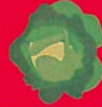
SALADE mai à octobre