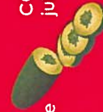
CONCOMBRE juillet à octobre

Manger des produits de ta région limite les transports !