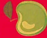
POMME septembre à mai