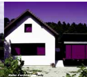
Atelier d'architecture Lardy