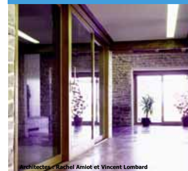
Architectes : Rachel Amiot et Vincent Lombard